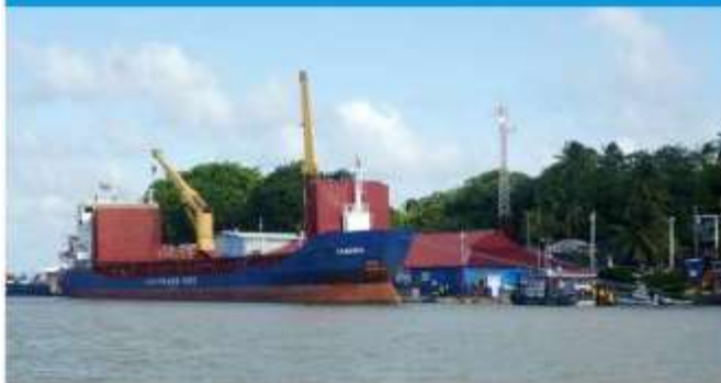
Puerto El Bluff